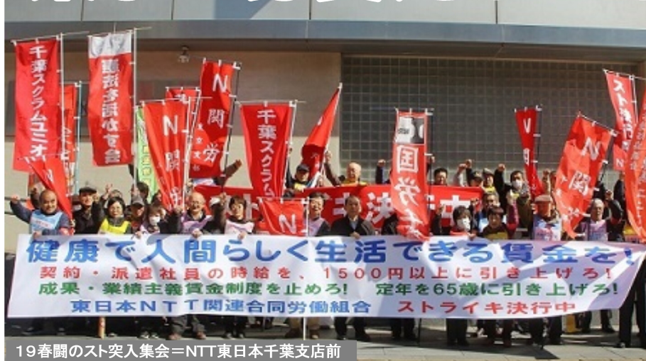
19春闘のスト突入集会=NTT東日本千葉支店前