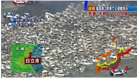
大震災で焼けた一千台の 輸出入乗用車 日立港

会社は「検証する」「会社の責任で実施する」とは言いますが、何一つ具体的な回答をしていません。震災時の帰宅方法や仮泊等の要求も含め、別途協議としました。