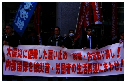
けんり春闘総行動(4/6経団連前)