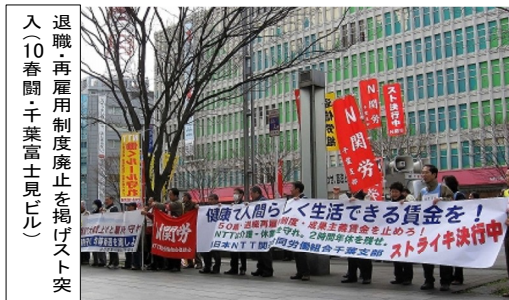
表1: 満了型と退職・再雇用の 年収格差は約200万円

毎年この時期になると、NTTに残る(満了型)か、あるいは大幅賃下げ・地域会社への再雇用かを迫る、「雇用選択」の説明があります。そして会社は、判で押したように「満了型を選べば単身赴任の二重生活」などと説得をします。ところが、会社は50歳の退職・再雇用者も各県をまたいでの遠隔地配転の提案の時期を狙っているようです。私たちは、こうした選べぬ「選択」に断固反対してたたかいます。