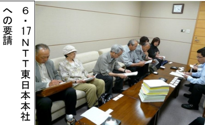
6・17NTT東日本本社への要請