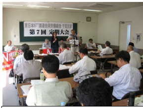
千葉支部第7回定期大会

りの職場実態に基づく要求前進のため、あたり前の労働運動の実践」。第2に「職場を基本にした分会体制を確立し、組合員拡大を展望した運動の展開」。第3に「個別課題である、退職・再雇用反対、成果・業績主義賃金制度反対、そして人間らしく文化的な生活を営むに必要な賃金の要求」を確認しました。