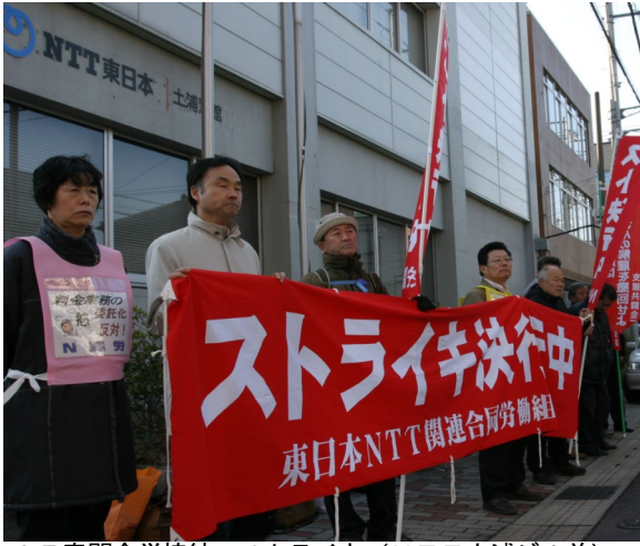
07春闘全労協統一ストライキ (NTT土浦ビル前)