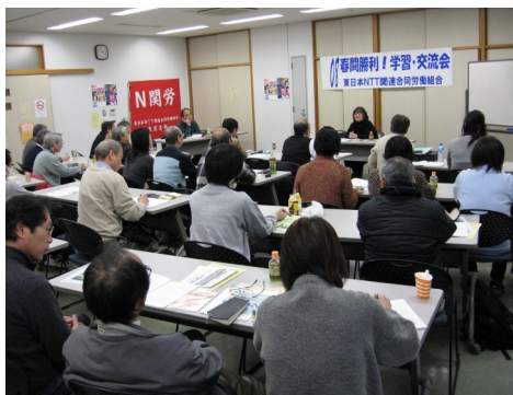
非正規の問題に聞き入る/2・9春闘学習会

相談窓口 ほっとライン あなたの悩み 一緒に解決します 03-6806-0255